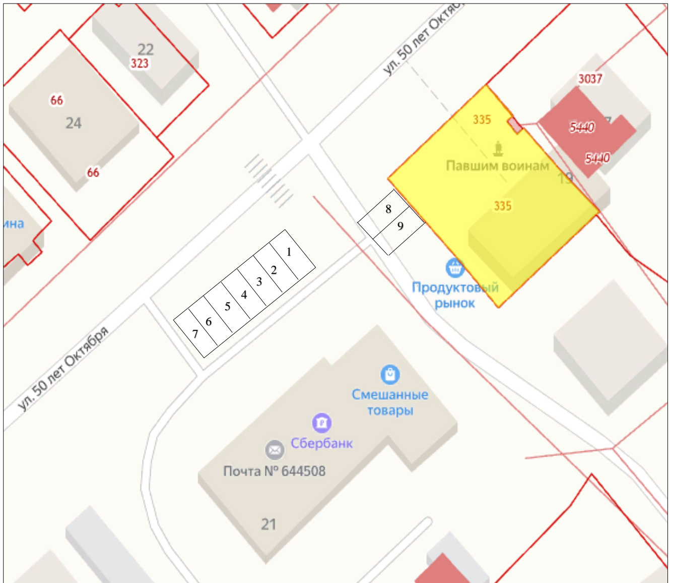
Схема размещения нестационарных торговых объектов № 1 - 9